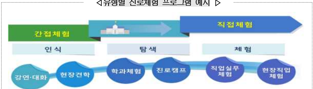
◁유형별 진로체험 프로그램 예시 ▷