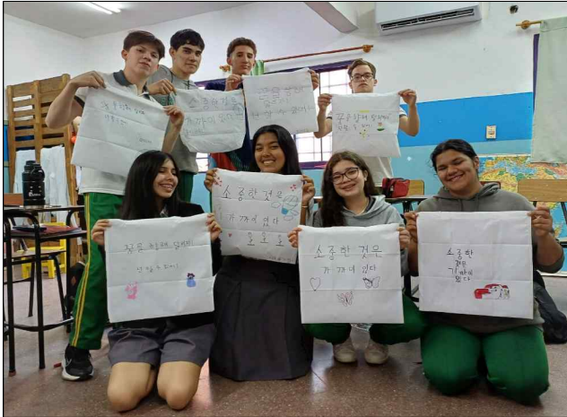
한국어 채택교 중등 문화 활동