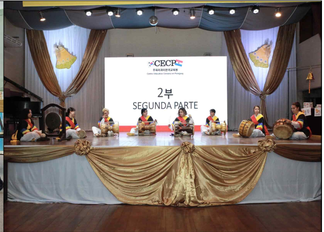
한국어 강좌 문화 수업