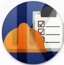
공사 및 시설물

코러스(KORUS, KOREAN university Resource United System)는 상호 조화와 협력을 상징하는 것으로 국립대학의 인적 물적 자원을 통합한 행 재정자원관리 시스템입니다.